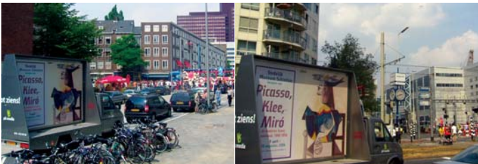
In Rotterdam tijdens het zomercarnaval én tijdens de wandel-4-daagse in Nijmegen (foto boven) was het warm en druk. De sfeer in beide steden was natuurlijk ook helemaal top!

dijk waar ik terecht kwam na het rondrijden. Tijdens het rijden kwam “Het dorp” van Wim Sonneveld uit de speakers, het uitzicht paste hier uitstekend bij en was prachtig. Ik zag allemaal fietsers op de dijk die gingen meezingen met het liedje van Wim Sonneveld. Ook de mensen in de tuin die aan het zonnen waren vonden het naar mijn mening erg leuk om dat oude liedje weer eens te horen. Toch wel een erg nette buurt en een mooie plek om te mogen wonen. Ik was weer in het centrum waar het inmiddels steeds drukker werd. Terwijl ik naast de wandelaars reed, zag ik meerdere mensen op de grond zitten doordat de warmte hen