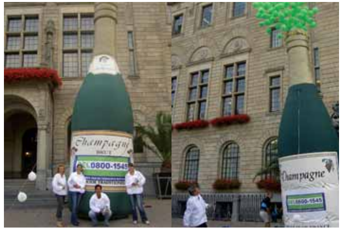
De burgemeester en onze meiden 'aan de fles', deze keer met wel zéér luchtige bubbels!