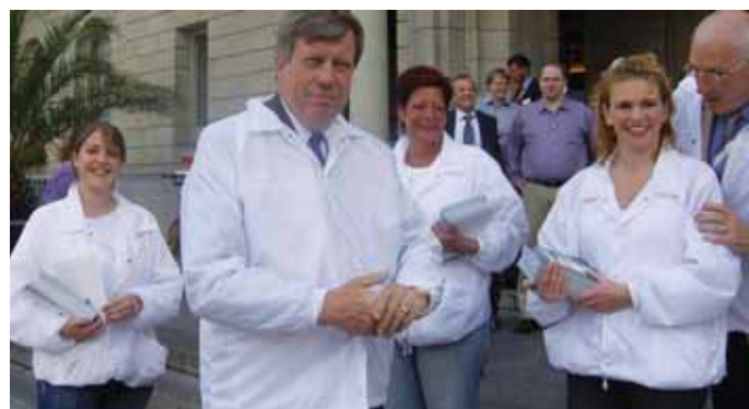
De burgemeester van Rotterdam, Ivo Opstelten en de meiden van NB Promotions gaan op pad.

foonnummer. Er werd allerlei promotiemateriaal, o.a. pennen, stickervellen met tattoos en beschermhoesjes voor mobiele telefoons, met daarop het logo van 1-telefoonnummer uitgedeeld.