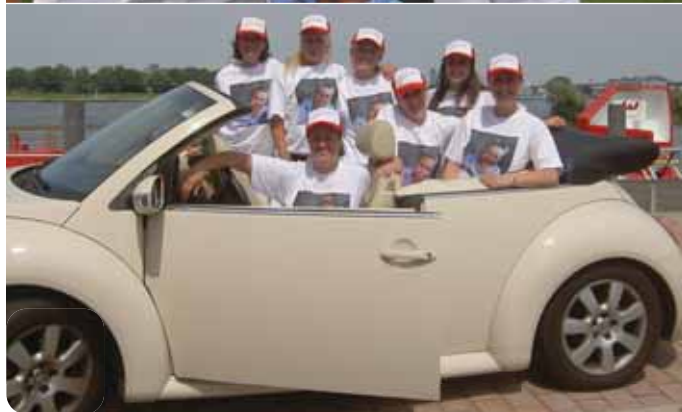
Jannes' meiden voor vertrek naar het 'verre' Almelo... iedereen was enthousiast!

de avond toch wel een manneke van een jaar of 3. Hij kwam met z'n vader aan de hand een tekening brengen voor Jannes. En daarbij kreeg ik een zontje van die kleine jongen! Geweldig vond ik dat. Je kunt dus gerust stellen